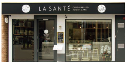
健康マルシェが兵庫県宝塚市に構える実店舗「LA SANTÉ」