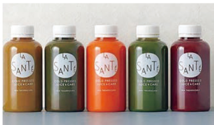
ジュース以外にも甘酒、ドレッシングなど様々な商品を展開