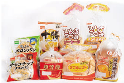
製パン用途のパッケージ